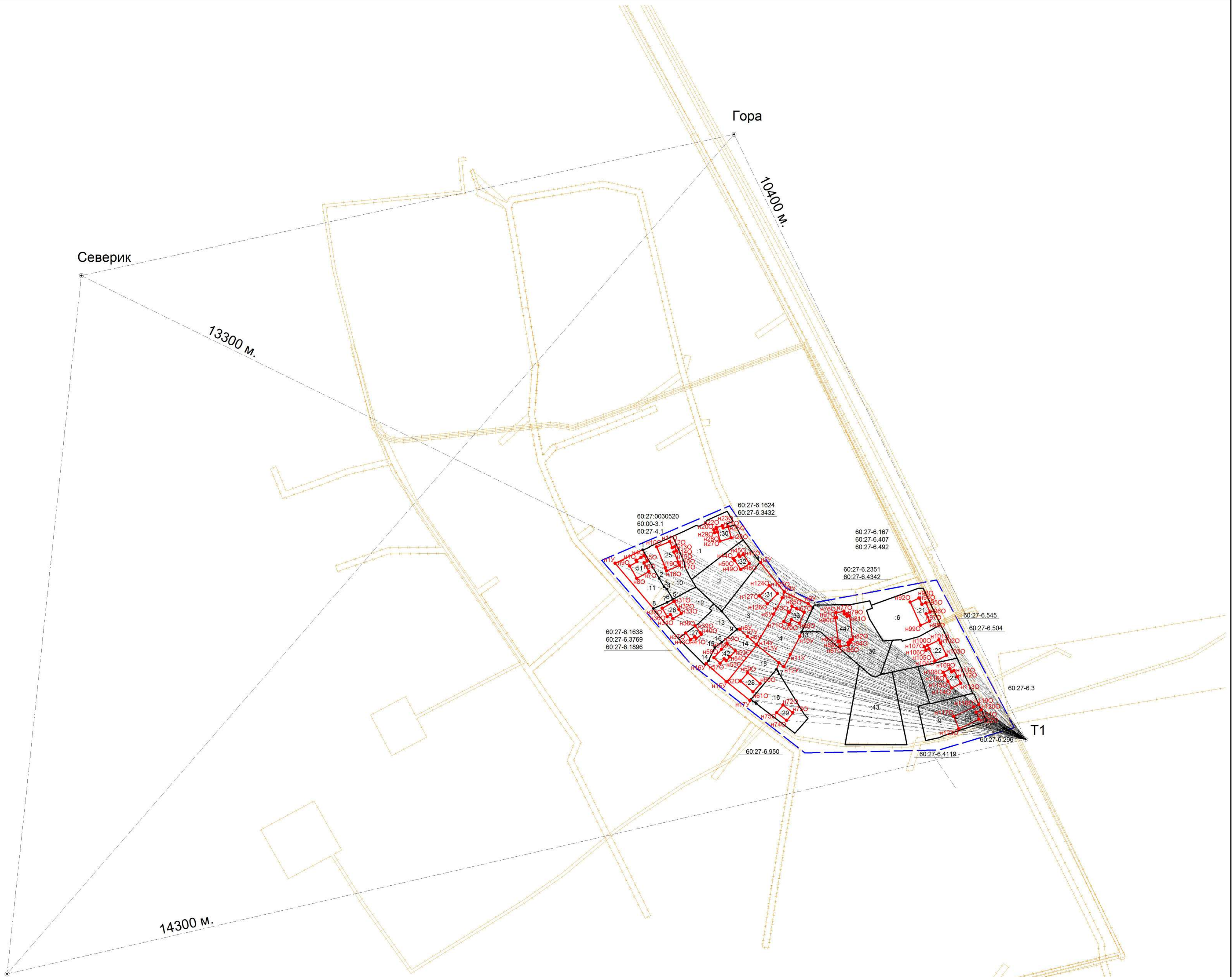
СХЕМА ГЕОДЕЗИЧЕСКИХ ПОСТРОЕНИЙ