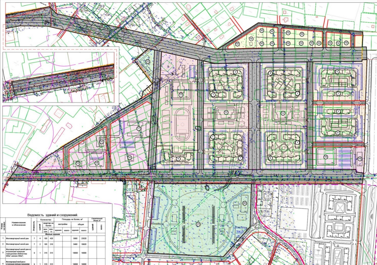
Ведомость зданий и сооружений